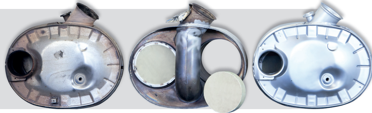
Príklad opravy katalyzátora VOLVO FH1FM

Riešenie máme pre tieto značky vozidiel: DAF, IVECO, MAN, MERCEDES, RENAULT, SCANIA, VOLVO